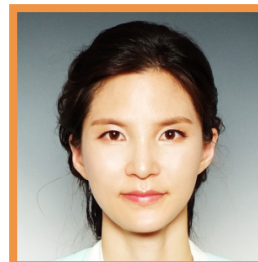
イ ハニ 執行役員 メディカル部門長 ファイザー株式会社