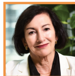
ビクトリア・エレガント APAC 社長 MAPS