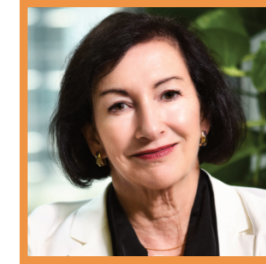
ビクトリア・エレガント APAC 社長 / VP 地域メディカルア フェアーズ MAPS / アムジェン