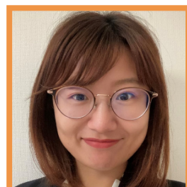
ピャオ イー メディカルアフェアーズ、サイエ ンティフィックイノベーションリ ード、ディレクター / メディカル アフェアーズ委員会 WG1 ギリアド・サイエンス株式会社 / 米国研究製薬工業協会